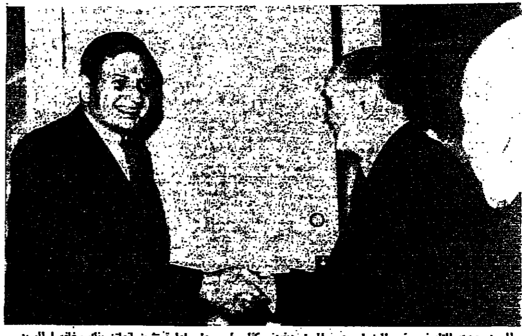
السيد بهجت التلهوني رئيس الوزراء يرحب بالسفير الجديد روكفلر ورئيس مجلس ادارة شيرمان هان بنك وخلفه السيد احمد طوقان نائب رئيس الوزراء